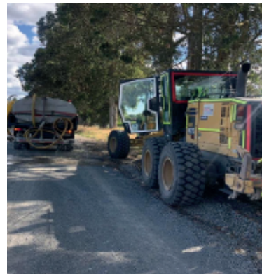
Inicio de obras

Un avance importante que beneficiará a muchos residentes del sector de los Bajos.