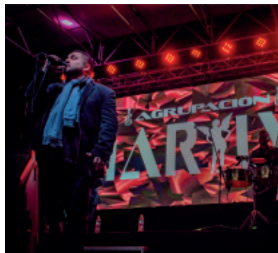
Noche de cierre festival

se Vive el Verano”, hoy se posiciona como uno de los eventos gratuitos y abiertos más grandes del Sur de Chile, destacando a la ciudad de Frutillar por el gran nivel de espectáculos, calidad, organización y puesta en escena.