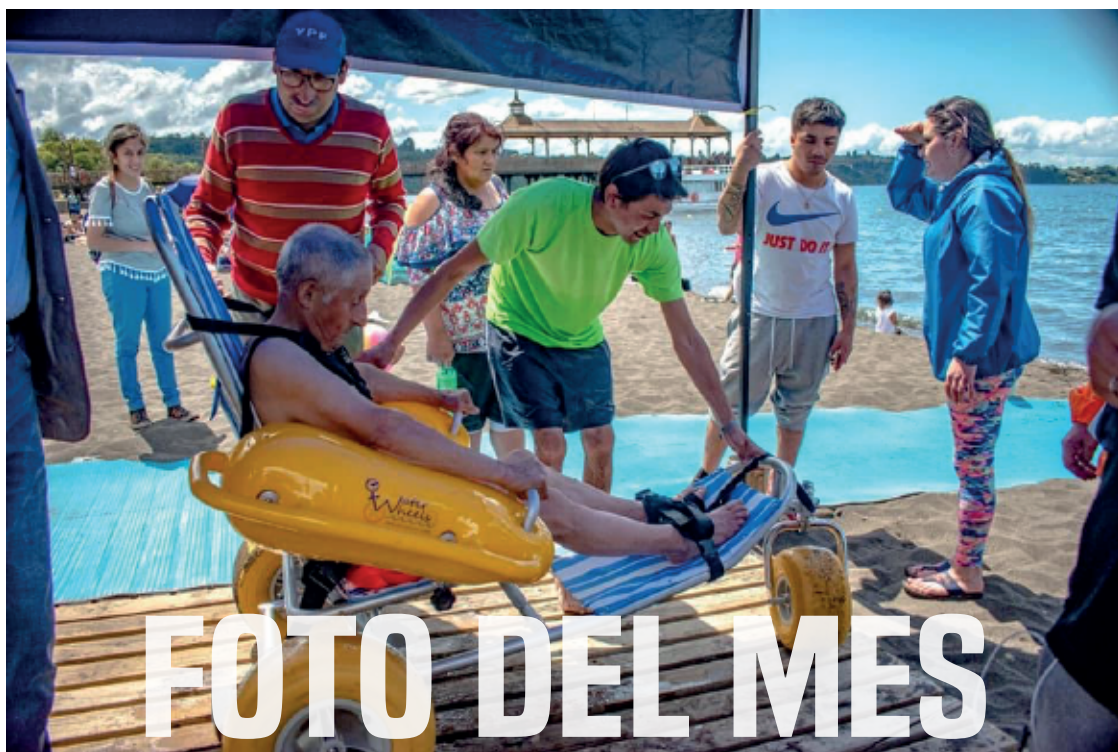
FOTO DEL MES

Tras varios meses de realizar un trabajo metódico en dependencias del Museo Colonial Alemán de Frutillar, el taller concluyó con la publicación de este libro colectivo “Puelche”, editado por sus propios participantes y su coordinadora.